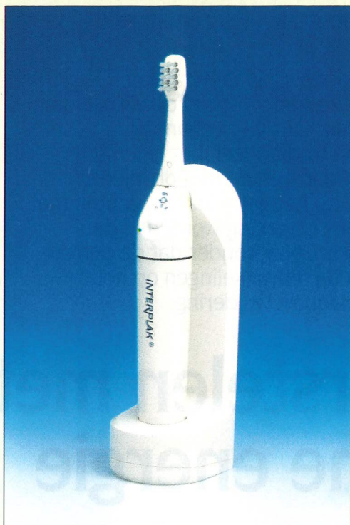
Afbeelding 3: Interplak.

De vraag die hier wordt gesteld, is of elektrische tandenborstels abrasie en poetstrauma's aan zachte weefsels kunnen veroorzaken. Omdat abrasie,