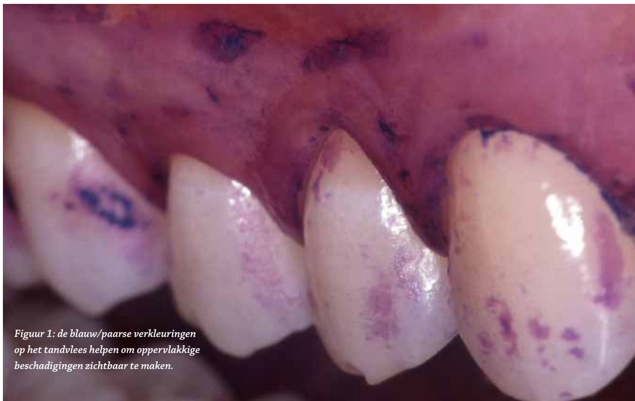
Figuur 1: de blauw/paarse verkleuringen op het tandvlees helpen om oppervlakkige beschadigingen zichtbaar te maken.

Aan de effectiviteit van oscillerende roterende elektrische tandenborstels wordt niet meer getwijfeld. De vraag die zich nu opwerpt is of deze elektrische borstels net zo veilig zijn in het gebruik als handtandenborstels. Met veiligheid wordt in deze context bedoeld het effect van het poetsen op zachte en harde orale weefsels.